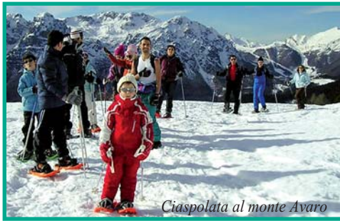
Ciaspolata al monte Avaro

desiderarla, rispettarla. Tutto questo più l'amicizia e l'affiatamento che si instaurano quando si fanno escursioni, passeggiate, sciate o ciaspolate, appare incredibile a chi la montagna non la frequenta. Non possono rinunciarvi chi - come gli amici di "zaino in spalla" - questi sentimenti, queste emozioni le vivono. Così Pro Loco Truccazzano organizza questi eventi particolari: alcuni per chi ha acquisito capacità da escursionista, altri per chi, la neve, la vive anche come sport e divertimento. Nella foto vediamo uno di questi momenti, diversi certo, ma legati fra loro dal filo conduttore del desiderio di vivere la montagna e il suo fascino.