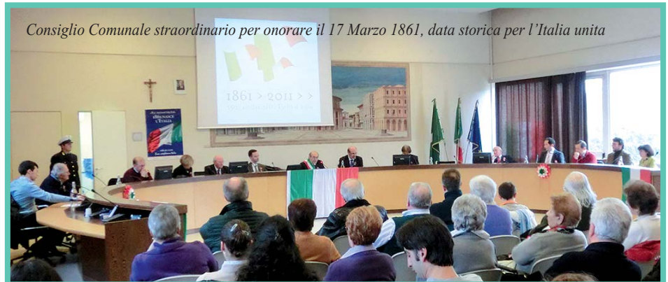
Consiglio Comunale straordinario per onorare il 17 Marzo 1861, data storica per l'Italia unita

e gli Italiani...Il momento storico che viviamo è difficile e molte sfide ci attendono: la crisi internazionale che ha messo in crisi il nostro sistema economico...l'immigrazione di chi scappa dalla povertà e dalle guerre ci fa paura...; l'Europa unita... dopo 60 anni, deve divenire una vera realtà politica...Lo abbiamo fatto, (n.d.r. il Consiglio Comunale) perché dobbiamo essere fieri del nostro Paese..."